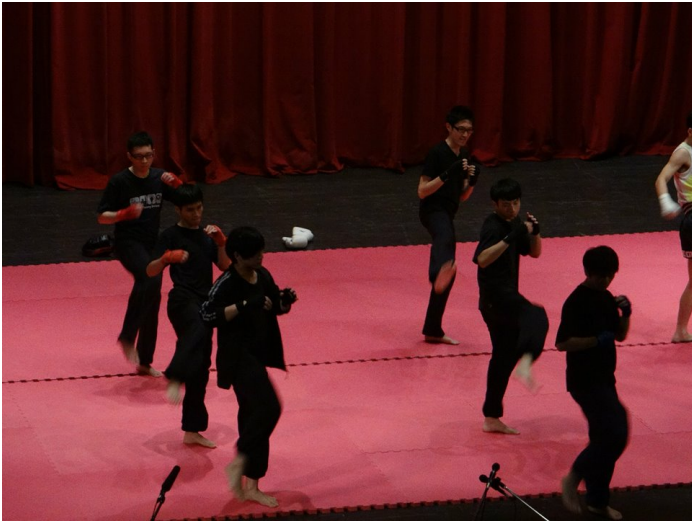
▲自由搏擊社表演

成果發表會之外，包含劍道社、太極社、合氣道社、佛朗明哥舞社、瑜珈社、跆拳道社、拳擊社等七大體適能社團，今年暑假還將齊聚基隆深美國小合辦「第一屆政大體適能夏令營」，將所學回饋社會。